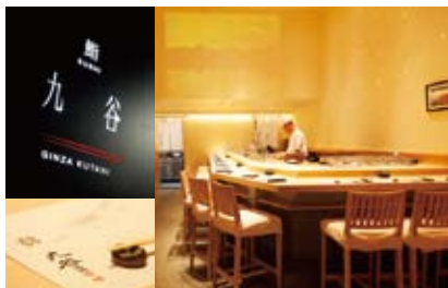
「銀座 鮭 九谷」 東京都中央区銀座7-3-9銀座LeeビルB1F ☎03-3573-8030 営業時間：平日／17:30～2:00 定休日：土・日・祝日 カウンター席／10席 4名様テーブル×2

まず最初に、茶碗蒸し風の食べるお吸い物をご紹介。クリティアでとったシジミのだし汁を卵1：だし3.5～4の割合で合わせ蒸すだけ。とろんとしたシジミのだしが味わえます。またアワビの夏の代表料理ともいえる「水貝」は、和風のピクルスの上にアワビを刺身でのせ、だし汁をかけ、酢橋をちょっと絞って、塩味と昆布だしと酸味でいただく一品。醤油をつけずにいただくのが味わい深いんです。この時のだし汁が先ほどお話ししたクリティアに爪昆布をつけたものです。最後にもうひとつ。マコガレイとホシガレイのアラを素焼きにし、クリティアでだしをとり、魚骨スープを作ります。そこに鰹と昆布を足せば、トリプルスープの出来上がり。このスープには、のど越しのよい岩のりとウニを合わせます。どれもだしをいただく一品ですね。和食はだしが命。そのおいしさを上手に引き出してくれるのがクリティアなんです。